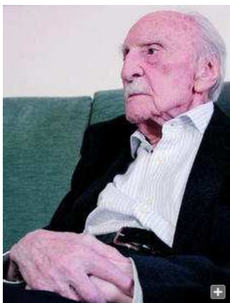
Ayala desvela su secreto: "Vivir y dejar vivir".